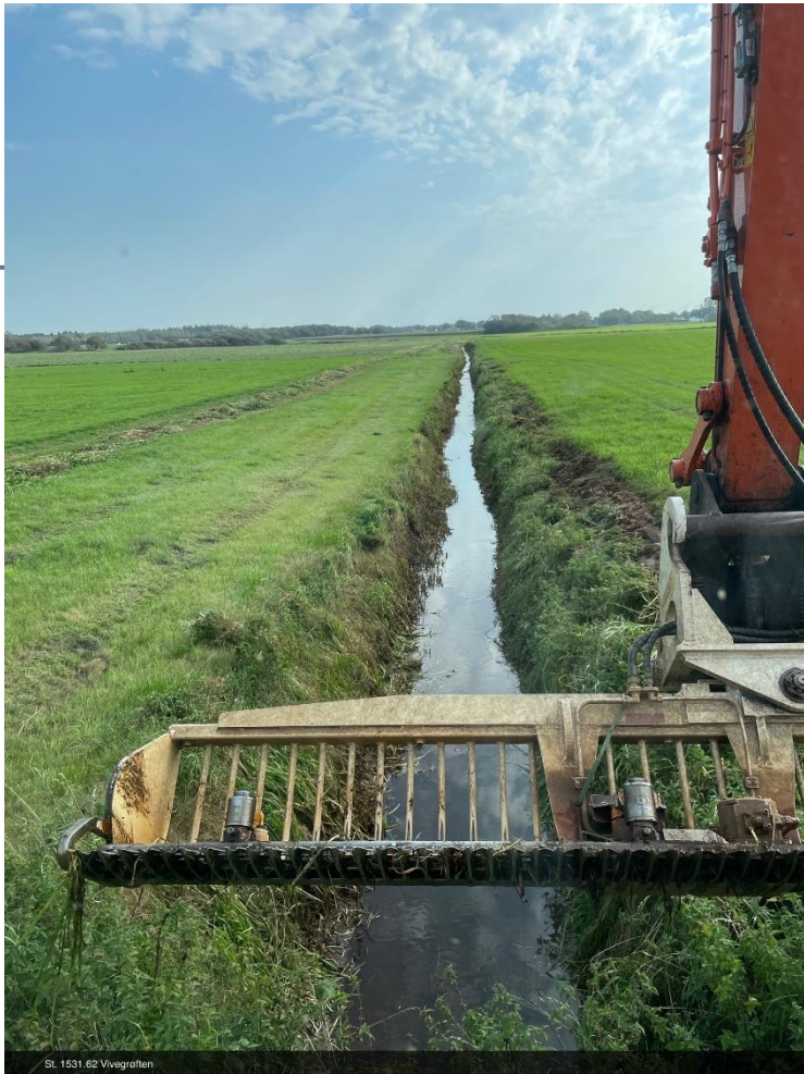
St. 1531.62 Vivegroften