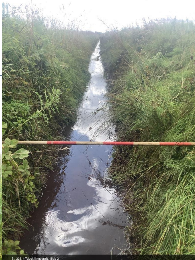
St. 338.1 Tolvskejlingsgrøft, tillob 3