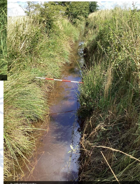
St. 1480.70 Ellehusgrøften